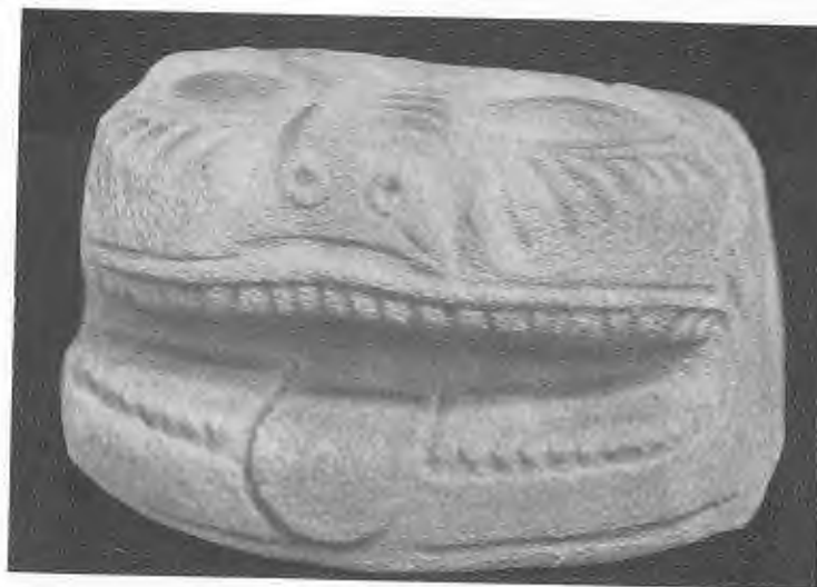
Fig. 7 — TESTA DI LEONE IN PIETRA SERENA TROVATA ENTRO IL TUMULO DI MONTECALVARIO