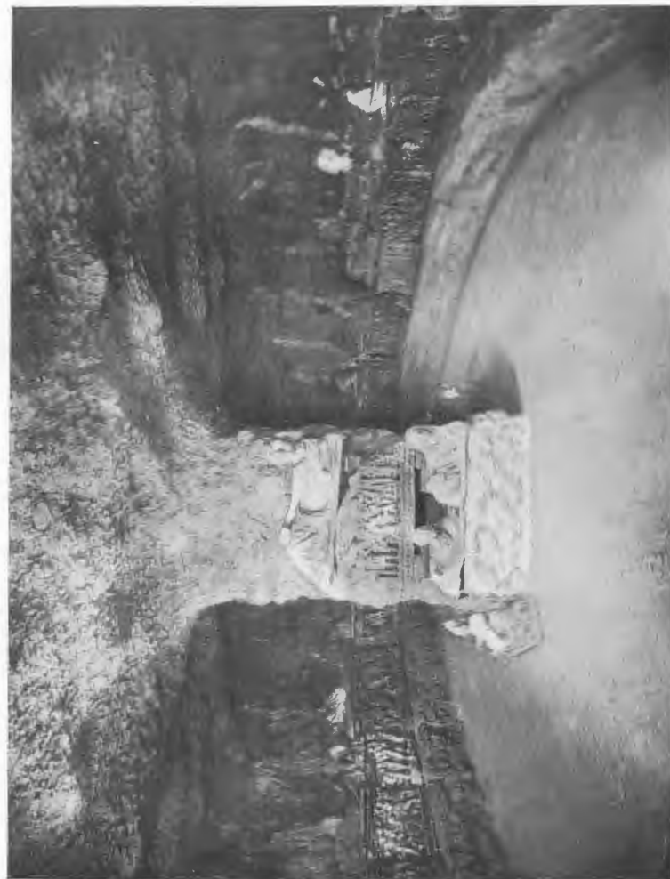
Fig. 2 — TOMBA INGHIRAMI DI VOLTERRA RICOSTRUITA NEL GIARDINO DEL MUSEO ARCHEOLOGICO DI FIRENZE