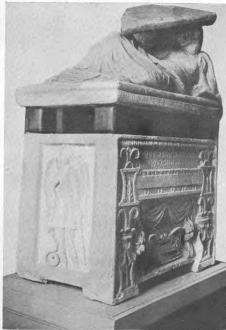
Fig. 1 — URNA PRINCIPALE DELLA TOMBA DEI "CALINTI SEPUS", A MONTERIGGIONI