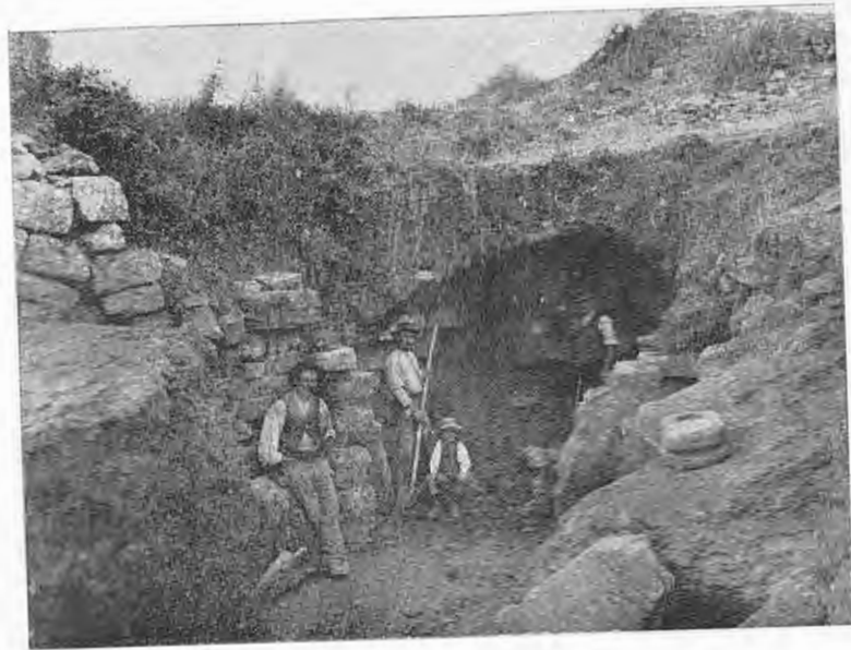
Fig. 6 — SCAVO DELL' IPOGEO MERIDIONALE SOTTO IL TUMULO DI MONTECALVARIO.

Le false volte che ricoprono corsie e vani (fig. 5) si presentano quali le descrive il Marmocchini e quali pur si vedono nelle tombe di Camucia, di Populonia, di Vetulonia, del sec. VII a. C.