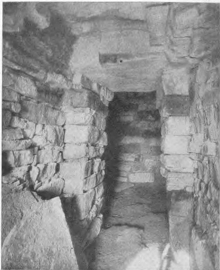
Fig. 5 — INTERNO DELL' IPOGEO OCCIDENTALE SOTTO IL TUMULO DI MONTECALVÁRIO