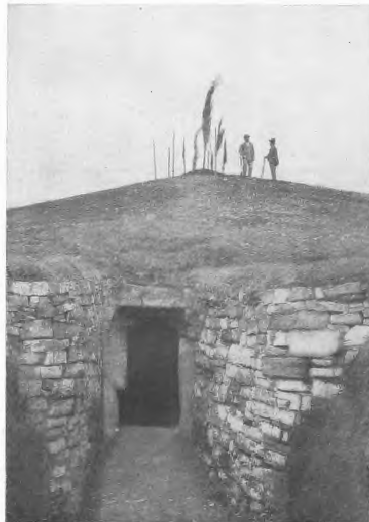
Fig. 4 — IPOGEO ORIENTALE SOTTO IL TUMULO DI MONTECALVARIO.